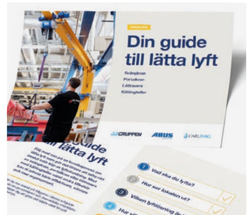
Förenkla valet inför lättare lyft