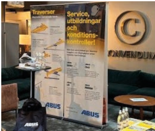
Träffa ABUS på höstens bransch- och temadagar