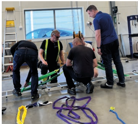
En annorlunda traversförarutbildning